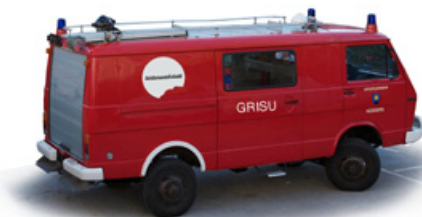
_____GRISU das tortenmobil

unser mobiles einsatzfahrzeug „grisu“ sucht für den winterschlaf einen geeigneten stellplatz. grisu schläft von november bis mai und ist absolut pflegeleicht. damit er nächsten sommer wieder bei den torten ausseneinsätzen dabei sein kann braucht er viel ruhe und schlaf.